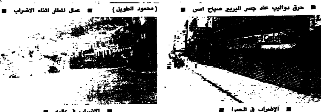
عمل المظفر لانه الاضراب